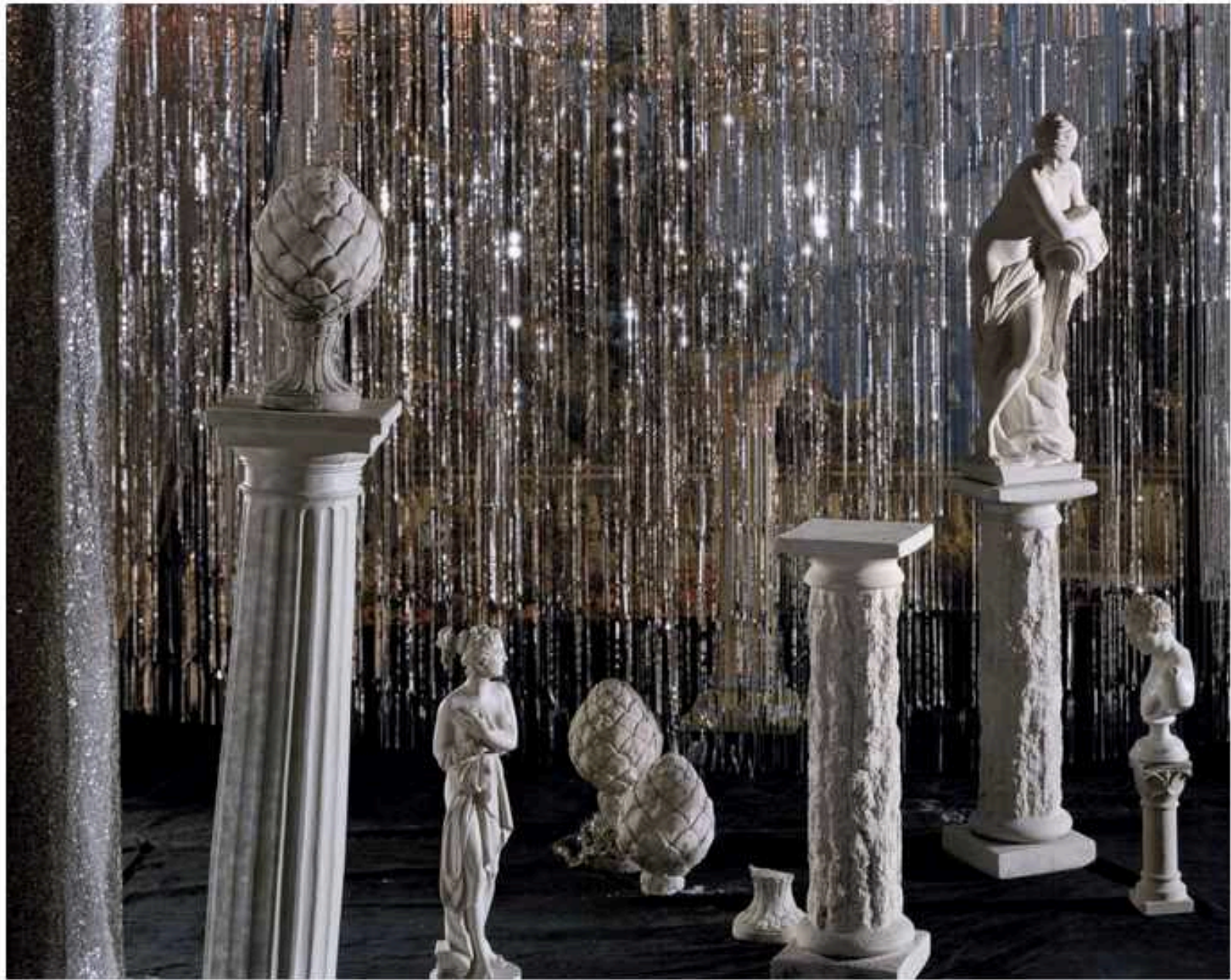
Voir crist crosé, 2019 © Delphine Solley