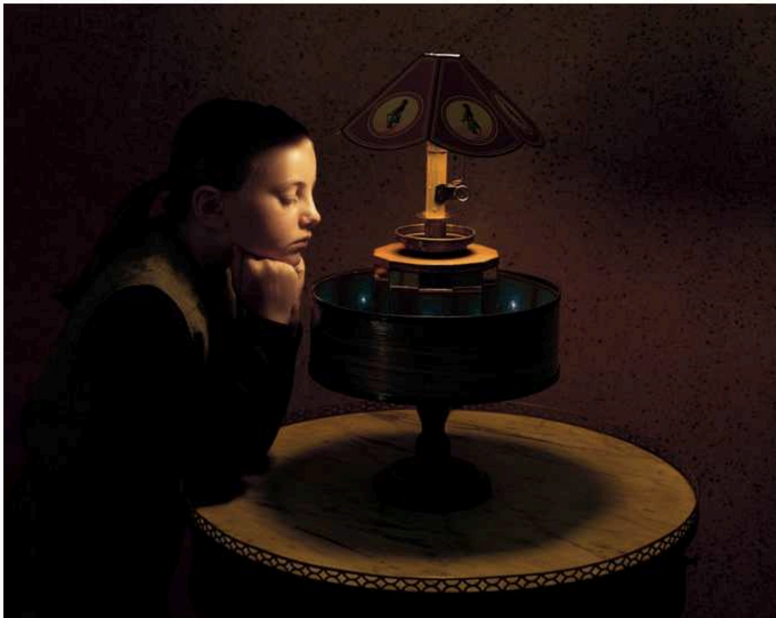
Vincentz croix, 2019 - Proxoscope © Dalphine Bailly