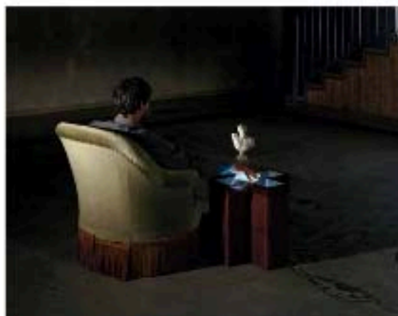
Delphine Balley, Psychôme , série « Voir c'est croire ».