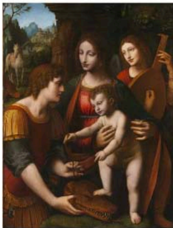
Bernardino Luini, Vierge à l'Enfant entourée de Saint Georges et d'un ange musicien . Vendu 2,3 millions d'euros le 14 novembre 2019.