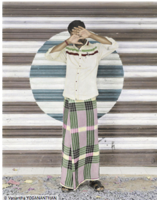
Mareecha's Magic trick Kattumannarkovil, Tamil Nadu, India 2018, Black and White C-print hand-painted by Jaykumar Shankar