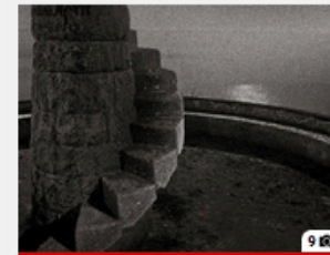
La carte des limites du monde, par Alain Willaume