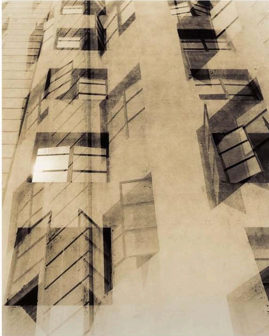
Windows / Guillaume Zuili

"Urban Jungle" révèle une empreinte photographique singulière, qui n'a cessé de s'affirmer au fil du temps. Des œuvres poétiques, d'une grande profondeur où mélancolie et douceur l'emportent.