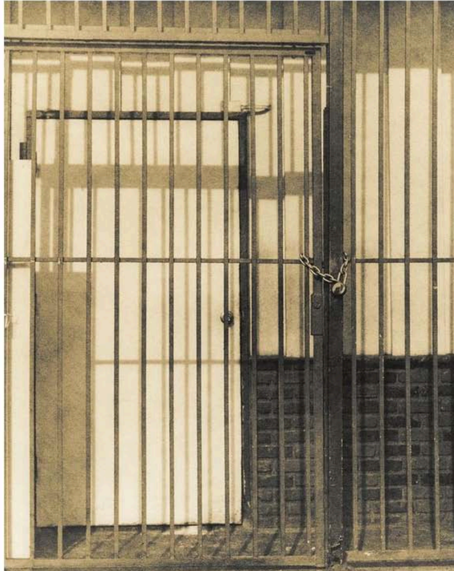
Chain On Fence / Guillaume Zuili

La mémoire des villes européennes a longtemps été l'un des sujets de prédilection et d'inspiration de Guillaume Zuili . Aujourd'hui, son obsession se concentre autour du mythe américain, et du tirage de ses prises de vue.